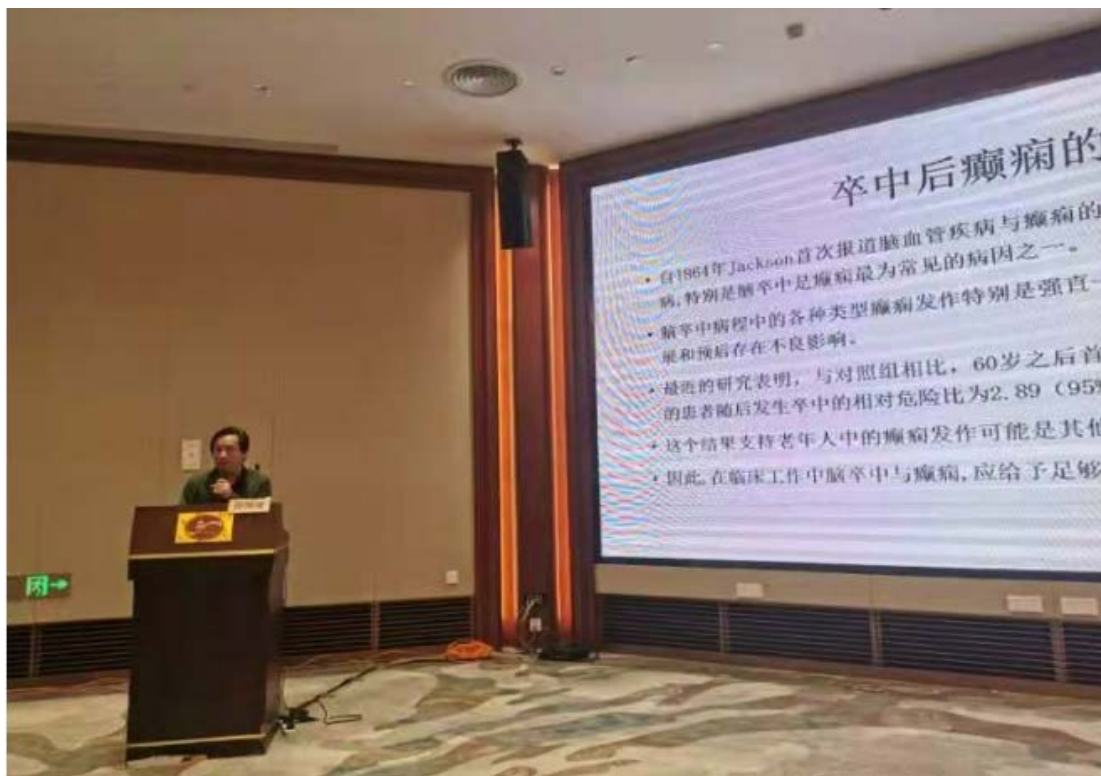
图表 4 樊红彬教授讲课：